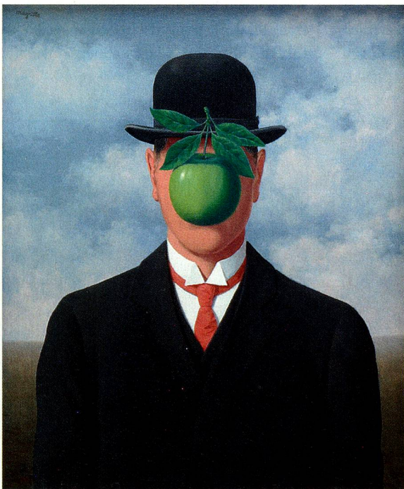
«Der grosse Krieg» René Magritte, 1964