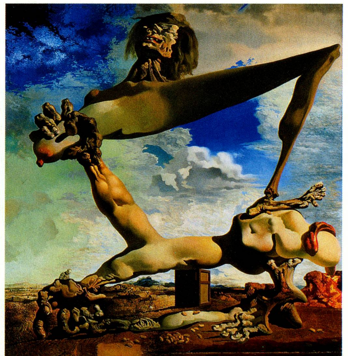
«Weiches Konstrukt mit gekochten Bohnen – Vorahnung des Bürgerkriegs» Salvador Dalí, 1936