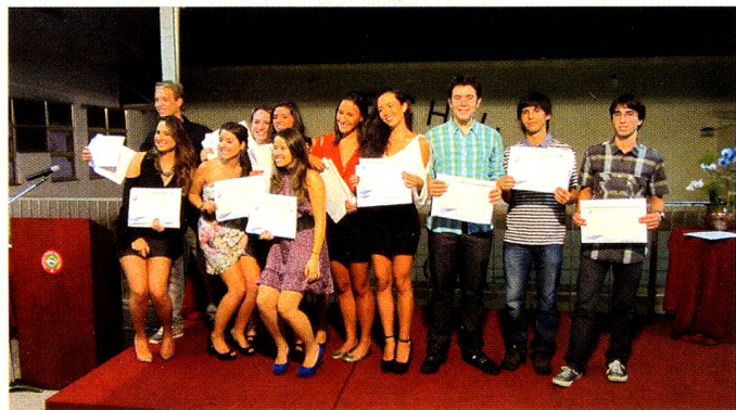
Os formandos de 2011

O resultado dos nossos alunos ficou acima da média mundial.