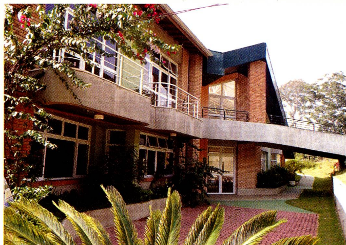
O acolhedor Retiro Suíço em Campo Limpo Paulista

Nossas funções básicas são filantrópicas, ajudando e apoiando pessoas com dificuldades. Porém, a atividade principal é administrar o Retiro Suíço , um lar acolhedor para idosos e pessoas convalescentes. Nosso objetivo principal é ser uma extensão do lar, proporcionando aos residentes um ambiente familiar de paz, sossego e tranquilidade. Oferecemos aos hóspedes, além do ambiente tranquilo, uma alimentação saudável, enfermagem e assistência médica, hidra- e fisioterapia, atelier para trabalhos manuais e locação em apartamentos ou chalés individuais com facilidades privativas. Desde a decoração ao atencioso atendimento, em nada lembra