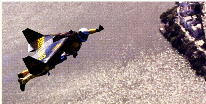
O “jetman” suíço sobrevoou Rio de Janeiro durante mais de 11 minutos

O único homem voando com uma asa rígida equipada com quatro reatores, o suíço Yves Rossy, chamado o “Jetman” (homem jato), pulou de um helicóptero em cima da Lagoa Rodrigo de Freitas, na cidade do Rio de Janeiro, antes de estabilizar sua asa e de voar com toda a potência dos reatores na direção do Corcovado, contornando a estátua do Cristo Redentor e seguindo em direção do Pão de Açúcar, seguindo ao longo das praias de Ipanema e de Copacabana, antes de abrir seu paraquedas e aterrissar sem problema na praia. A proeza, realizada no