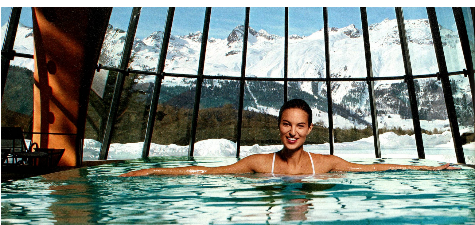
Kronenhof, Pontresina, Graubünden