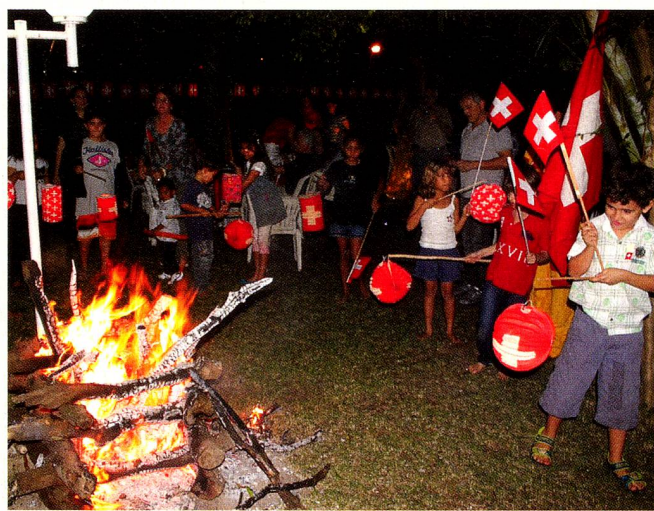
O desfile com lampiões ao redor da tradicional fogueira empolgou as crianças.

A Festa Nacional Suíça foi comemorada com total sucesso em Salvador, no sábado 6 de agosto, na "Casa Suíça", onde quase 180 Suíços e Amigos da Suíça se encontraram.