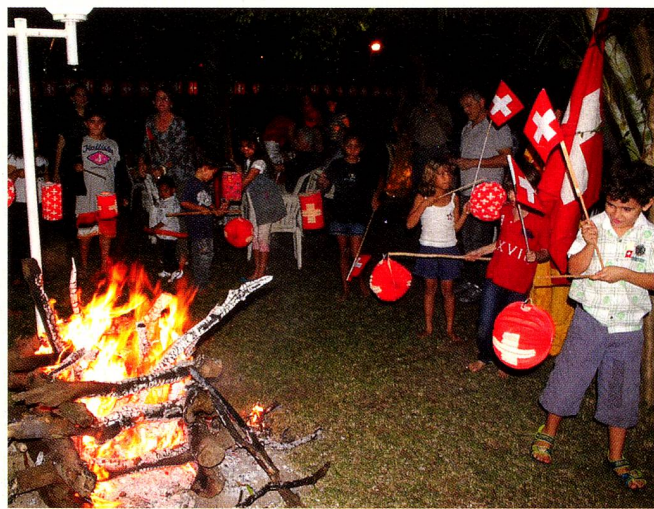
O desfile com lampiões ao redor da tradicional fogueira empolgou as crianças.

A Festa Nacional Suíça foi comemorada com total sucesso em Salvador, no sábado 6 de agosto, na "Casa Suíça", onde quase 180 Suíços e Amigos da Suíça se encontraram.