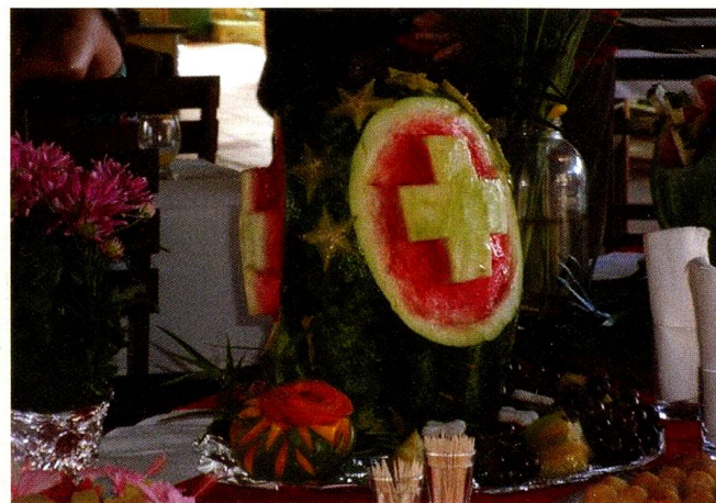
Uma bandeira da Suíça criativa no lindo bufê montado para a festa de 1º de Agosto

Como muitos Suíços vivem em Pecém / CE, foi decidido que este ano a festa de comemoração do Dia Nacional da Suíça, não seria organizada na capital cearense,