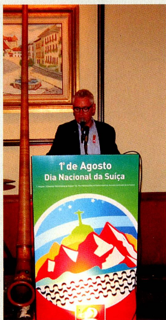
O Cônsul Geral da Suíça Hans-Ulrich Tanner dirigiu palavras de saudação aos convivas.

A Festa Nacional da Suíça deste ano no Rio de Janeiro foi a mais animada e bem sucedida em muitos anos! O jantar comemorativo, no dia 1º de agosto, reuniu no Restaurante Casa da Suíça aproximadamente 170 Suíços e Amigos da Suíça para um evento cuja realização foi possível graças ao patrocínio da empresa suíça Dufry, que também ajudou ativamente na organização.