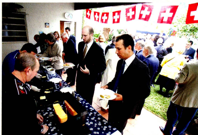
No jardim da residência do Cônsul Geral foi servido o típico prato suíço "raclette".