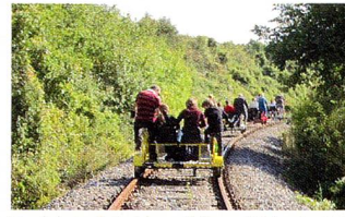
Draisinenfahrt im schönen Weinviertel.

Nachdem letztes Jahr das Draisinenfahren im Burgenland viel Spass gemacht hat, haben wir auf vielseitigen Wunsch erneut eine Draisinenfahrt organisiert, und zwar im Weinviertel. Dieses Mal ging's von Ernstbrunn nach Asparn. In dieser lieblichen Landschaft, die stark an die Toscana erinnert, traten wir in die Pedale. Es ging rauf und runter, eine Strecke von 12,5 km, die wir auch wieder zurückfahren mussten. Der Spass war gross, die Anstrengung eben-