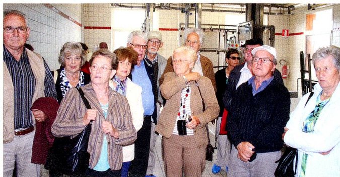
Sauris, Schinkenfabrik – unsere staunenden Vereinsmitglieder

Fahrer auch einen versierten Reiseführer zu Verfügung, der uns mit seinen fundierten Kenntnissen einen umfassenden Eindruck über die geografischen Besonderheiten des Friauls, seine wechselvolle Geschichte, die heute mit den verschiedenen Sprachgruppen, friulanisch mit slowenischen und deutschen Sprachinseln zum Ausdruck kommt, geben konnte. In Bordano besuchten wir das Schmetterlingsmuseum, das uns mit tausenden freifliegenden Schmetterlingen auf einem Spaziergang durch amazonische Regenwälder und afrikanischen Dschungel einen lebensnahen Eindruck vermitteln konnte. Anschliessend konnte unser Busfahrer sein Können in der Bewältigung einer anspruchsvollen Bergstrecke, die uns eine überwältigende Aussicht in die beeindruckende Bergwelt ermöglichte, unter Beweis stellen. Durch enge Tunnel und Kurven erreichten wir schliesslich unser eigentliches Tagesziel Sauris mit seiner Schinkenfabrik. Ein Rundgang durch den sauberen Betrieb, der mit seinen 52 Mitarbeitern deutsche und italienische Schweine zu Schinken, Speck, Osso Collo etc. verarbeitet, machte uns gespannt auf die anschliessende Verkostung, die zugleich unser Mittagessen war. Um etliche Eindrücke bereich-