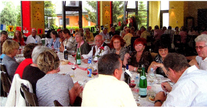
Ein wunderschönes Fest zum 10-jährigen Jubiläum.

wechslungsreich und für Jedermann. Es wurde auch ein Beitrag zum Thema „Heimat“ verfasst und vorgetragen und die Ehrenpräsidentin und Gründerin des Schweizerklubs erzählte über die Entstehung und den Anfang. Was wäre so ein schöner Jubiläumsanlass ohne ein Quiz mit Fragen über die Schweiz? Mitglieder verkleideten sich als berühmte Schweizer Persönlichkeiten aus Geschichte und Sport. Dazu gab es noch einige Fragen und nun durfte fleissig geraten werden. Auf der Bühne standen in tollen Kostümen, der Schellenursli, Roger Federer,