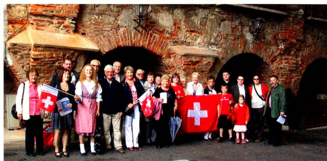
Die Sängertuppe in den Kasematten