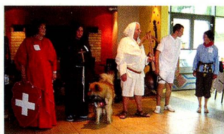
Verkleidet für das Jubiläumsquiz!

wechsungsreich und für Jedermann. Es wurde auch ein Beitrag zum Thema „Heimat“ verfasst und vorgetragen und die Ehrenpräsidentin und Gründerin des Schweizerklubs erzählte über die Entstehung und den Anfang. Was wäre so ein schöner Jubiläumsanlass ohne ein Quiz mit Fragen über die Schweiz? Mitglieder verkleideten sich als berühmte Schweizer Persönlichkeiten aus Geschichte und Sport. Dazu gab es noch einige Fragen und nun durfte fleissig geraten werden. Auf der Bühne standen in tollen Kostümen, der Schellenursli, Roger Federer,