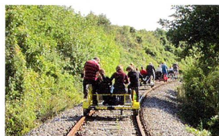
Draisinenfahrt im schönen Weinviertel.

Nachdem letztes Jahr das Draisinenfahren im Burgenland viel Spass gemacht hat, haben wir auf vielseitigen Wunsch erneut eine Draisinenfahrt organisiert, und zwar im Weinviertel. Dieses Mal ging's von Ernstbrunn nach Asparn. In dieser lieblichen Landschaft, die stark an die Toscana erinnert, traten wir in die Pedale. Es ging rauf und runter, eine Strecke von 12,5 km, die wir auch wieder zurückfahren mussten. Der Spass war gross, die Anstrengung eben-