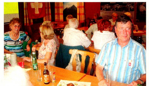
In gemütlicher Runde wurden verschiedene Biere degustiert.