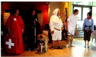
Verkleidet für das Jubiläumsquiz!

wechslungsreich und für Jedermann. Es wurde auch ein Beitrag zum Thema „Heimat“ verfasst und vorgetragen und die Ehrenpräsidentin und Gründerin des Schweizerklubs erzählte über die Entstehung und den Anfang. Was wäre so ein schöner Jubiläumsanlass ohne ein Quiz mit Fragen über die Schweiz? Mitglieder verkleideten sich als berühmte Schweizer Persönlichkeiten aus Geschichte und Sport. Dazu gab es noch einige Fragen und nun durfte fleissig geraten werden. Auf der Bühne standen in tollen Kostümen, der Schellenursli, Roger Federer,