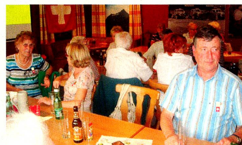
In gemütlicher Runde wurden verschiedene Biere degustiert.