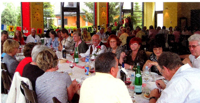
Ein wunderschönes Fest zum 10-jährigen Jubiläum.

wechsungsreich und für Jedermann. Es wurde auch ein Beitrag zum Thema „Heimat“ verfasst und vorgetragen und die Ehrenpräsidentin und Gründerin des Schweizerklubs erzählte über die Entstehung und den Anfang. Was wäre so ein schöner Jubiläumsanlass ohne ein Quiz mit Fragen über die Schweiz? Mitglieder verkleideten sich als berühmte Schweizer Persönlichkeiten aus Geschichte und Sport. Dazu gab es noch einige Fragen und nun durfte fleissig geraten werden. Auf der Bühne standen in tollen Kostümen, der Schellenursli, Roger Federer,