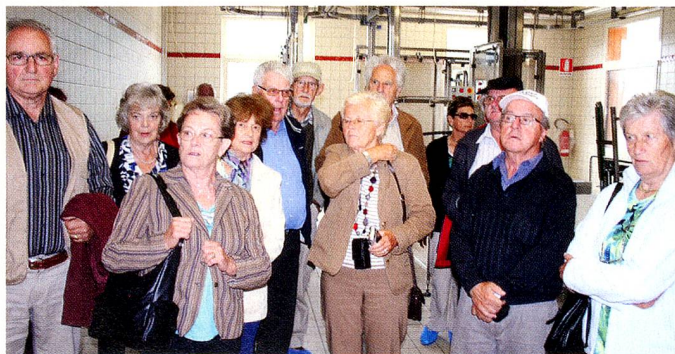
Sauris, Schinkenfabrik – unsere staunenden Vereinsmitglieder