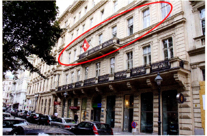
Schweizerische Botschaft in Österreich, 1010 Wien, Kärntnerring 12.

Jubiläumsfeier – 10 Jahre Schweizerklub Slowenien In diesem Jahr darf der Schweizerklub Slowenien sein 10-jähriges Bestehen feiern. Der Klub wurde am 3. März 2001 in Rogaska Slatina gegründet und ins Leben gerufen. Wir alle sind sehr stolz auf unseren Klub und deshalb war Anfang dieses Jah-