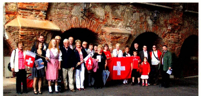
Die Sängertuppe in den Kasematten