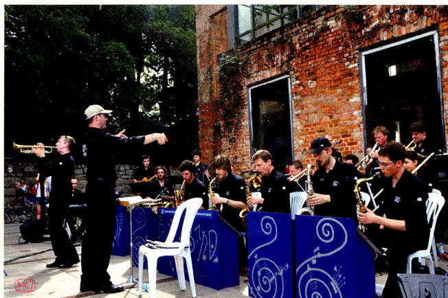
Logo na sua chegada ao Brasil, a ETH-Big Band de Zurique tocou com grande sucesso na Casa das Ruínas, em Santa Teresa, no Rio de Janeiro.

ração científica e educacional, estabelecendo um canal permanente entre elas e, desta forma, facilitando o intercâmbio futuro entre os estudantes suíços no Brasil e os estudantes brasileiros na Suíça. Neste sentido, reuniões com as reitorias e direções acadêmicas da Universidade Federal do Rio de Janeiro (UFRJ), da Universidade Federal de Minas Gerais (UFMG) e da Universidade de São Paulo (USP) foram realizadas.