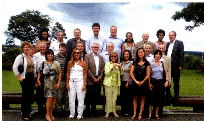
Os representantes da Embaixada da Suíça no Brasil, dos Consulados Gerais em São Paulo e no Rio de Janeiro e dos oito Consulados Honorários no Brasil se encontraram em Brasília para uma nova conferência consular.

A conferência consular das representações suíças no Brasil ocorreu este ano em Brasília. Foi discutido entre outros assuntos, o aprofundamento da cooperação entre as representações da Suíça no Brasil, especialmente a questão da realização efetiva das tarefas consulares de base.