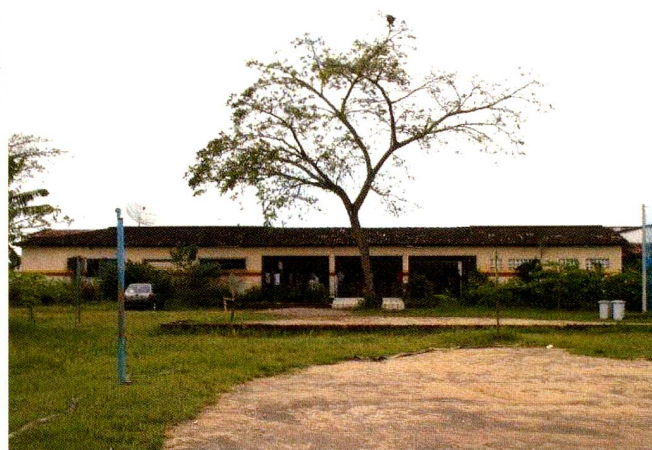
A Escola Municipal Albin Stahli, em Igarassu / PE

Nordeste do Brasil, o Suíço Pablo Stähli fundou em 1997, em Zurique