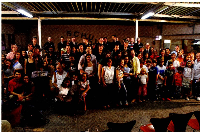
Na Escola Suíço-Brasileira do Rio de Janeiro, a ETH-Big Band de Zurique encantou o numeroso público.

Na segunda-feira à noite, a ETH-Big Band se apresentou na Escola Suíço-Brasileira no Rio de Janeiro e conquistou o público formado pelos alunos, seus pais, familiares e amigos, e pelos professores e funcionários da Escola. No intervalo, um representante da ETH falou sobre a Faculdade e a importância das faculdades suíças em geral. A turnê teve sequência no Brasil com um concerto na Escola de Música da Universidade Federal de Minas Gerais e, finalmente, na Escola de Comunicação e Artes da Universidade de São Paulo (USP). (Fonte: Maurício Thuswohl - swissinfo.ch )