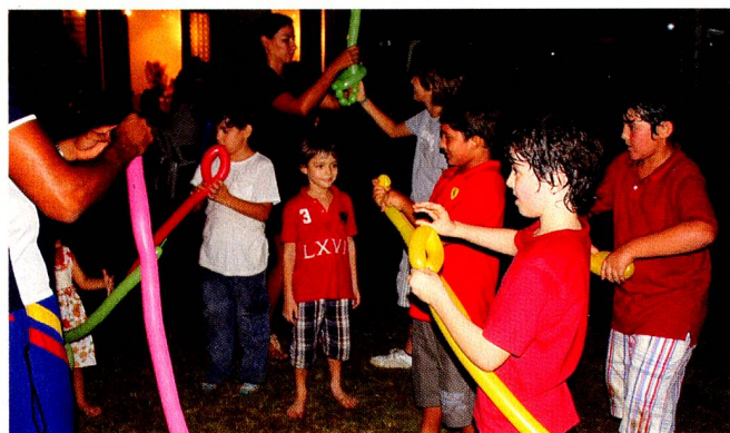
As crianças se divertiram com as brincadeiras animadas pelo palhaço.

palhaço para a alegria das crianças, que brincaram e pularam até tarde.