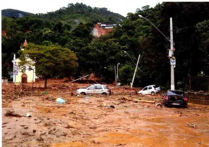
A cidade de Nova Friburgo, fundada por imigrantes suíços, foi a mais atingida na catástrofe que assolou a Região Serrana do Rio de Janeiro.

Nova Friburgo foi causada por deslizamentos de terrenos tão violentos e rápidos que fizeram com que tudo fosse destruído de um segundo a outro, não como uma inundação tradicional, onde a água sobe pouco a pouco. Houve um choque, como um golpe comparável a um terremoto. Diante da amplitude da catástrofe, a Presidente da Suíça Micheline Calmy-Rey, decidiu mandar ao lugar da tragédia uma missão do Corpo Suíço de Ajuda Humanitária, para dar apoio aos cidadãos suíços eventualmente tocados pela catástrofe, além de fazer um reconhecimento das necessidades mais urgentes onde a Suíça poderá ajudar Nova Friburgo.