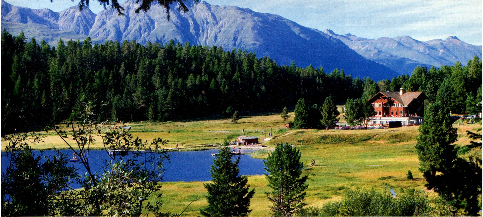
Hotel Lej da Staz, Stazersee, St. Moritz