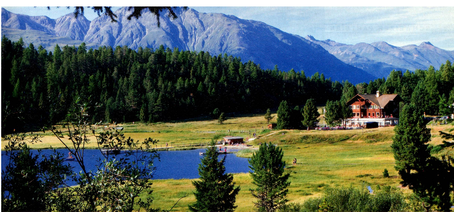
Hotel Lej da Staz, Stazersee, St. Moritz