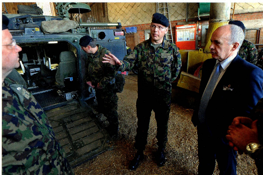
Der Vorsteher des Departementes für Verteidigung, Bevölkerungsschutz und Sport beim Truppenbesuch mit Brigadier Daniel Berger: Bundesrat Maurer leitet das grösste Departement im Bundeshaus.

der Aufträge, welche Politik und Volk der Armee erteilt hat. Aber zumindest die Friedenseinsätze sind umstritten und beeinflussen deshalb die Diskussion um die Armee negativ. Ich bin persönlich nicht gegen Auslandseinsätze. Aber ich möchte dem Ausland etwas typisch Schweizerisches anbieten. Eine Art Nischenprodukt, das mit unserem Land identifiziert wird. Wasserspezialisten zum Beispiel. Eine Arbeitsgruppe wird mir Vorschläge machen, und auch das wird Teil des Sicherheitspolitischen Berichtes sein.