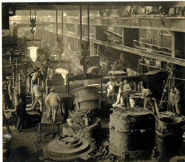
Giesserei Sulzer in Winterthur, 1919