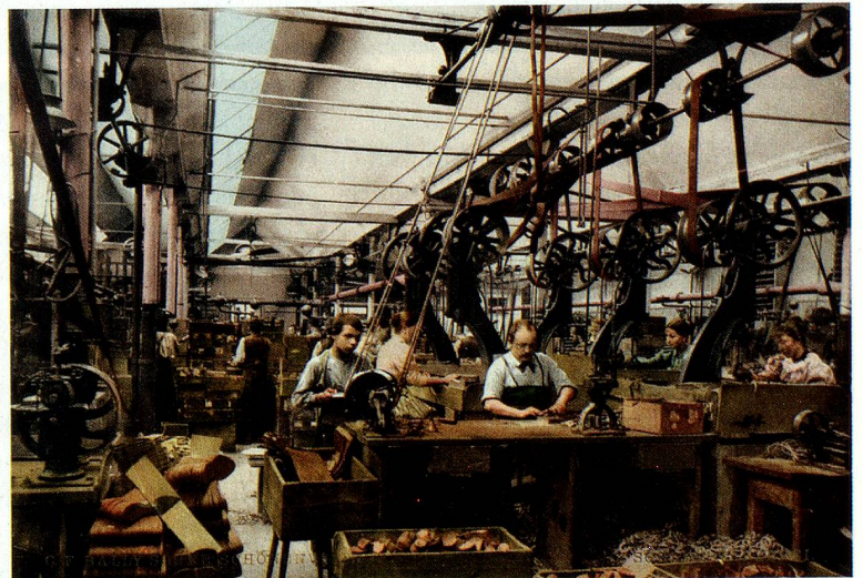
Die Schreinerei der Schuh- fabrik C.F. Bally in Schönen- werd, um 1900