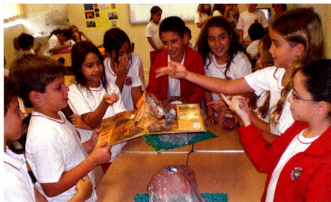
Após uma pesquisa sobre os vulcões, os alunos do 4º ano construíram uma maquete.

A Escola Suíço-Brasileira Rio de Janeiro foi recentemente, autorizada a oferecer o programa do IB Diploma e aceita como escola candidata para a implementação do Programa dos Anos Primários (PYP).