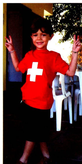
Os torcedores suíços em Salvador já se preparam para a Copa do Mundo 2010 !

Na Casa Suíça em Salvador, o time suíço, vice-campeão, contou com uma torcida organizada que se reuniu em torno de um farto churrasco para assistir à final e acompanhar a partida, ensaiando para a Copa do Mundo 2010, no próximo mês de junho na África do Sul. Todos os jogos que a Suíça vai disputar serão transmitidos na Casa Suíça, contando com o maior número possível de torcedores suíços!