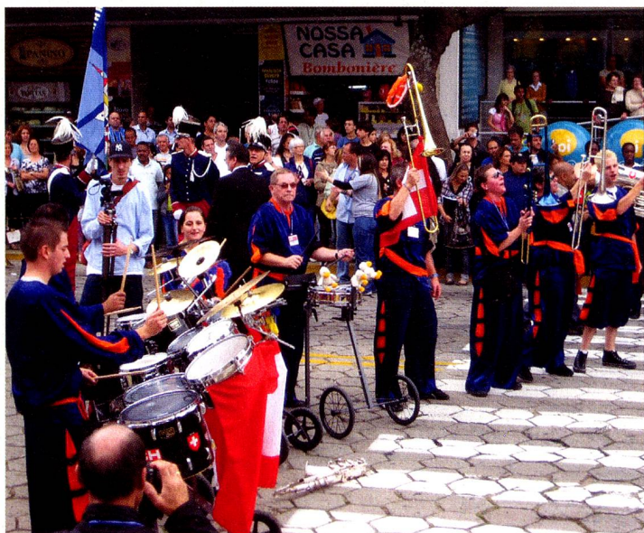
A banda „Guggenmusik Trois Canards” empolgou o público.

Os 330 suíços vindos do cantão de Fribourg passaram primeiro, saudando as gerações de famílias de descendentes nascidos no Brasil. O desfile teve a participação de numerosas bandas, grupos artísticos e folclóricos, corais de crianças e de adultos, da Suíça e de Nova Friburgo. As escolas de samba de Nova Friburgo fecharam o cortejo com muita animação.