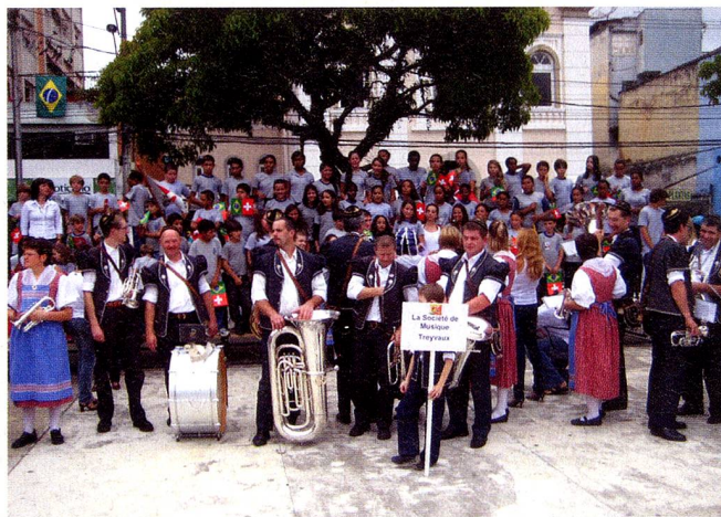
A Société de Musique de Treyvaux desfilou em trajés típicos.