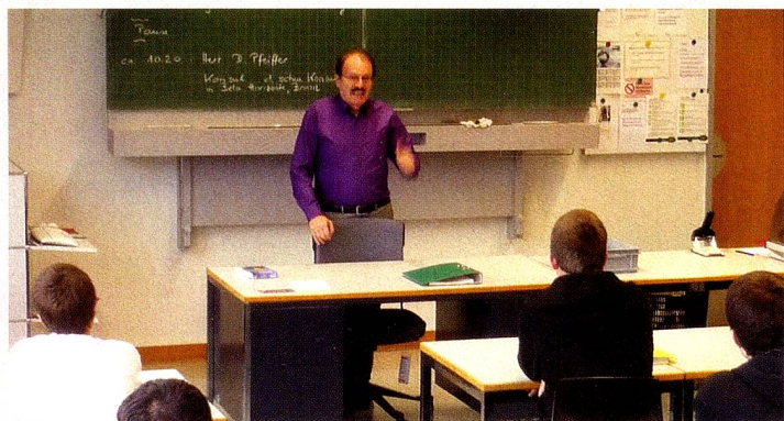
O Cônsul Honorário da Suíça em Belo Horizonte proferiu palestra em Berna.

dado a ir ao Café Federal, no dia da eleição do novo ministro, o "Bundesrat" Didier Burkhalter, e teve a oportunidade de cumprimentar todos os ministros e o presidente da Suíça, Rudolf Merz. Foi um almoço inesquecível e inédito, que só pode acontecer na Suíça nestas circunstâncias.