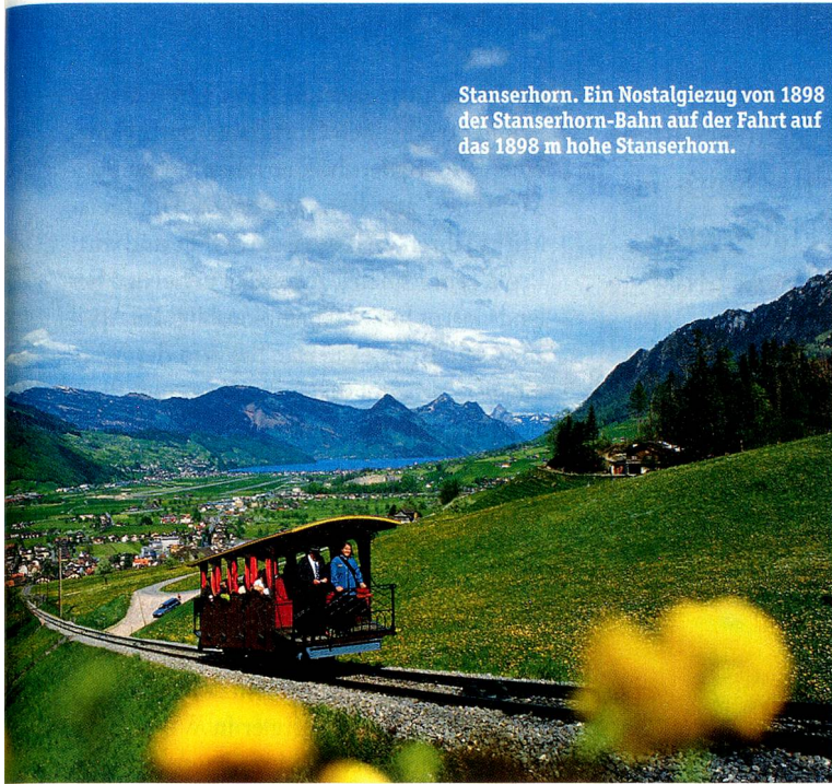
Stanserhorn. Ein Nostalgiezug von 1898 der Stanserhorn-Bahn auf der Fahrt auf das 1898 m hohe Stanserhorn.