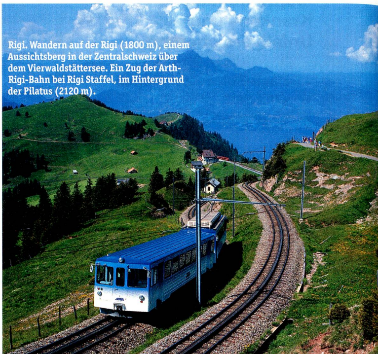
Rigi. Wandern auf der Rigi (1800 m), einem Aussichtsberg in der Zentralschweiz über dem Vierwaldstättersee. Ein Zug der Arth-Rigi-Bahn bei Rigi Staffel, im Hintergrund der Pilatus (2120 m).