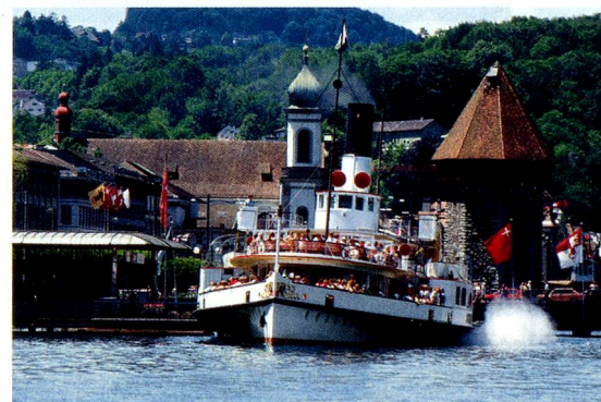
Ein Dampfschiff der Vierwaldstättersee flote bei der Schifflande am Bahnhof Luzern.

Unter www.MySwitzerland.com/aso präsentiert Schweiz Tourismus verschiedene Offerten für kurze und längere Aufenthalte in der Schweiz. Die Top-Angebote sind bis zu 35 Prozent günstiger und regelmässig verfügbar.