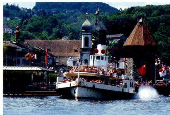
Ein Dampfschiff der Vierwaldstätterseeflotte bei der Schifflande am Bahnhof Luzern.

Unter www.MySwitzerland.com/aso präsentiert Schweiz Tourismus verschiedene Offerten für kurze und längere Aufenthalte in der Schweiz. Die Top-Angebote sind bis zu 35 Prozent günstiger und regelmässig verfügbar.