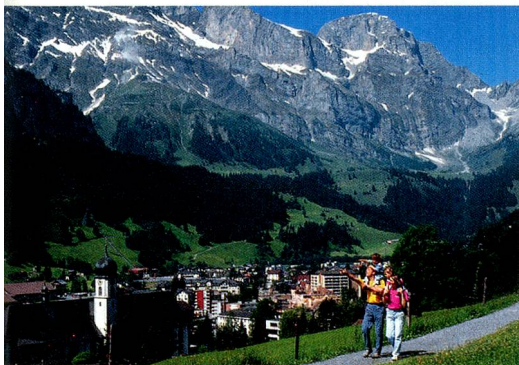
Engelberg (1000 m) im Kanton Obwalden in der Zentralschweiz. Benediktinerkloster aus dem zwölften Jahrhundert.

Exklusive Spezialangebote für Auslandschweizer verfügbar unter www.MySwitzerland.com/aso