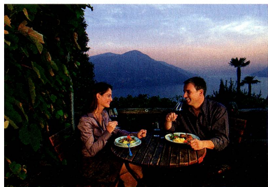
Grotto im Kanton Tessin

Historische Spezialität der Luzerner Zünfte Die Lozärner Chüge-