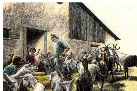
Illustration von Hannes Binder aus dem neuen Heidi-Buch.

Trotz dieses herben Rückschlags: Die Schweiz tut mehr für ihre Staatsangehörigen im Ausland als die meisten anderen Länder. Sie tut es, typisch schweizerisch, mit verteilten Rollen: hier Staat, da nichtstaatliche Institutionen. Allerdings geschieht dies ohne Gesamtkonzept. Vielmehr in pragmatischer Zusammenarbeit zwischen Behördenstellen und privaten Akteuren, in erster Linie der ASO. Zwar besteht ein Verfassungsauftrag, die Beziehungen der Auslandschweizerinnen und Auslandschweizer untereinander und zur Schweiz zu fördern. Aber es fehlt ein gesetzlicher Rahmen, der die Grundlinien der Auslandschweizerpolitik, die Stellung der Institutionen der Fünften Schweiz und die entsprechenden Ressourcen definiert. Die Zeit ist reif, ein Bundesgesetz über die Fünfte Schweiz zu schaffen. RUDOLF WYDER, DIREKTOR DER ASO, HERAUSGEBER DER «SCHWEIZER REVUE»