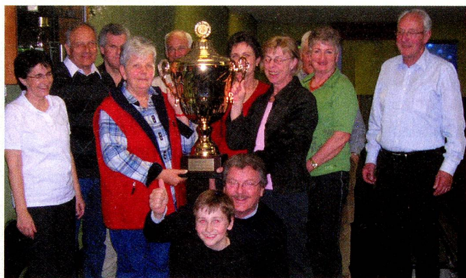
Resultate Kegelabend 2009