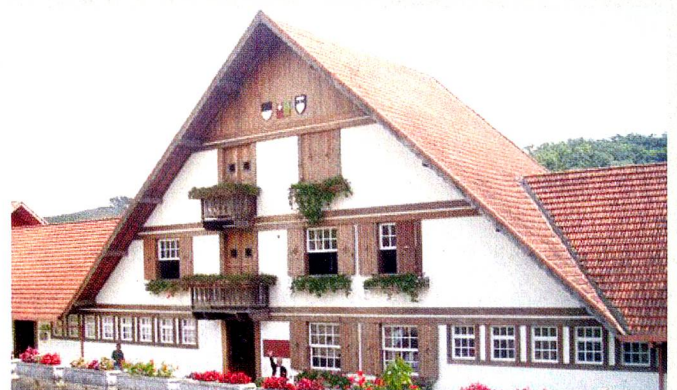
A bela « Casa Suíça » onde funciona a queijaria suíça, sede brasileira do Instituto Fribourg-Nova Friburgo.