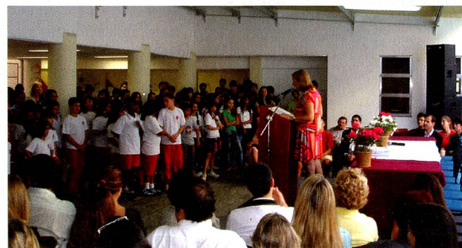
A emocionante cerimônia de entrega dos diplomas de língua estrangeira.

Mátricula Jovem, dirija-se à sua representação consular no decurso do ano em que completar 18 anos.