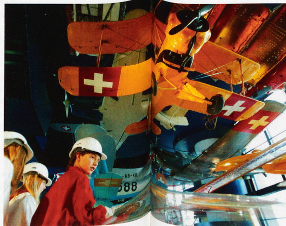
Die Geschichte der Fliegerei.