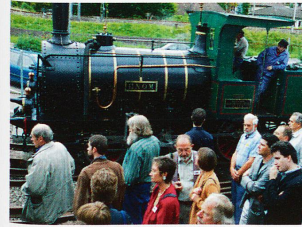
Ein Mekka für Bahnfreunde.

Nachdem in Zürich kein geeignetes Gelände für das geplante Verkehrsmuseum gefunden werden konnte, bot die Stadt Luzern dem Verein das 40 000 Quadratmeter grosse Lidogelände am Vierwaldstättersee an. Dem Verein Verkehrshaus der Schweiz gehörten damals neben den SBB und PTT, Privatbahnen und Verkehrsorganisationen grosse Unternehmen aus Handel, Industrie und Tourismus an. Die thematische Ausrichtung des Verkehrshauses widerspiegelt deshalb auch die Kommunikationsinteressen seiner Gründungspartner. Finanziell unterstützt wurde das Projekt ausserdem durch den Bund sowie Stadt und Kanton Luzern.