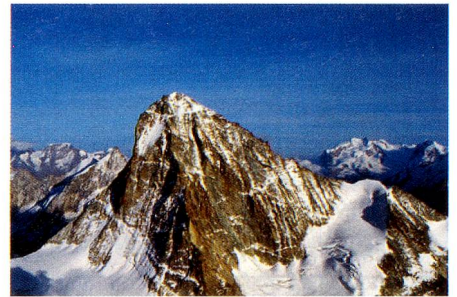
Dent Blanche VS, aus «Altitude 4000» (Seite 7).