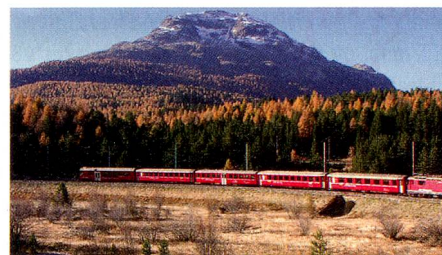
Rhätische Bahn aus «Die schönsten Verkehrsmittel der Schweiz» (Seite 7).