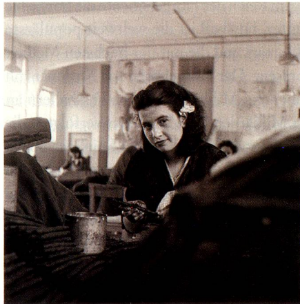
Tabakarbeiterin, Brissago, 1947.