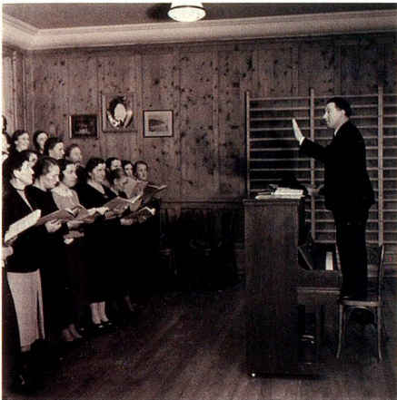
Gesangsprobe, Zuoz, 1939.