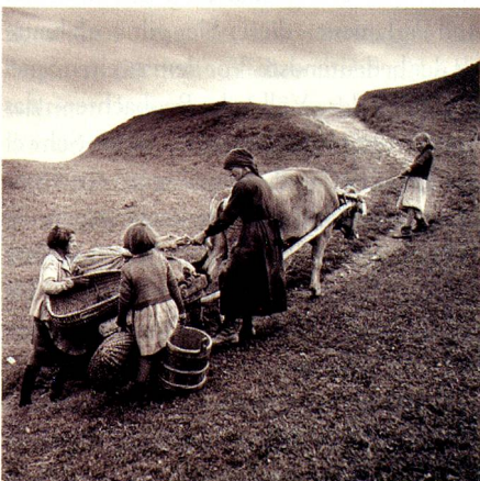
Kartoffelfuhre in Obersaxen, Plategna GR, 1948.