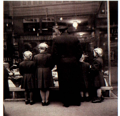
Silberner Sonntag, Zürich, 1948.