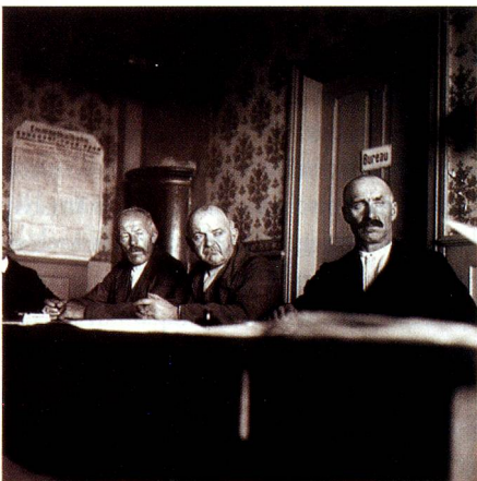
Gemeinderäte in Rüederswil, 1938.