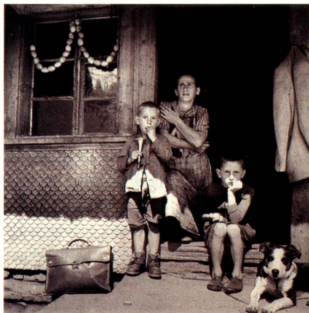
Flühli, Entlebuch, 1941.