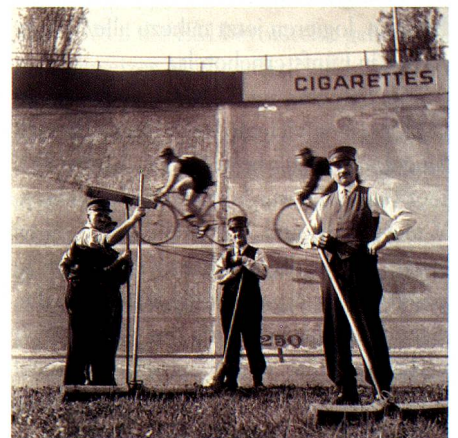
Radrennbahn, Zürich-Oerlikon, Dreissigerjahre.