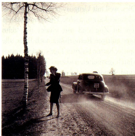
Strassenverkehr, Kanton Zürich, um 1949.