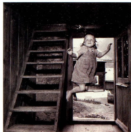
Der Sprung, 1955, Bild von Theo Frey.