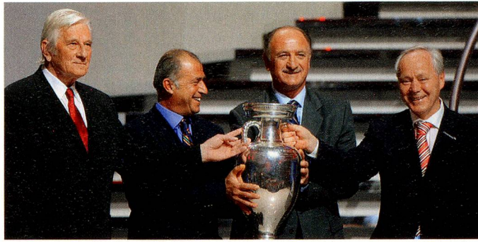
Fussball EM 2008 Auslosung: Der Trainer der Schweizer Fussball-Nationalmannschaft, Jakob «Köbi» Kuhn, Portugals Trainer Felipe Scolari, der türkische Trainer Fatih Terim und der tschechische Trainer Karel Brückner (von rechts) halten den Pokal bei der Gruppenauslosung für die Euro 2008 in Luzern am 2.12.2007.

Die Schweiz gehört in Sachen Logistik zur Weltspitze. Die Weltbank untersuchte 150 Länder und beurteilte deren Leistungsfähigkeit bei der Abwicklung internationaler Warensendungen. Die Schweiz belegt den 7. Rang.