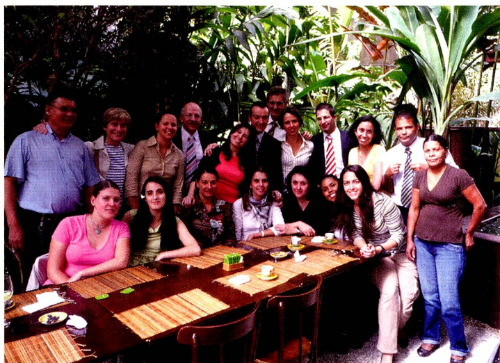
A equipe do Consulado Geral se reuniu para se despedir do Cônsul Rudolf Wyss

No dia 30 de agosto de 2008, o Cônsul Rudolf Wyss encerrou sua missão no Brasil. Ele foi intitulado com a função de Conselheiro de Embaixada para a Embaixada da Suíça no Estado do Kuwait.