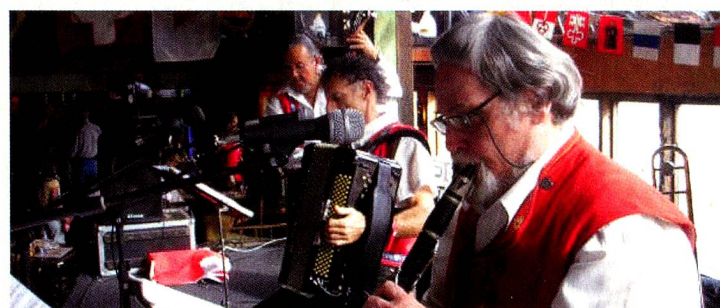
O "Trio Infernal", do Rio de Janeiro, animou a festa.