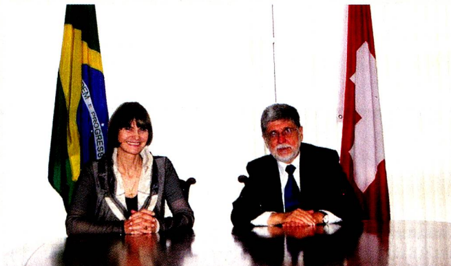
A Conselheira federal Micheline Calmy Rey e o Ministro Celso Amorim

No dia 15 de agosto, em São Paulo, a Conselheira Federal reuniu-se com representantes de empresas suíças no país que lhe expuseram os projetos sociais que desenvolvem no Brasil. Após uma breve visita do Consulado Geral, a Ministra encontrou-se com uma centena de membros da comunidade suíça. Ela aproveitou a oportunidade para agradecer os compatriotas pelas atividades desenvolvidas no Brasil, preservando os valores suíços. "Com uma comunidade suíça tão ativa e tão forte, eu não tenho nenhuma dúvida sobre a durabilidade da amizade de nossos dois países", disse a Conselheira Federal no encontro com a colônia suíça.