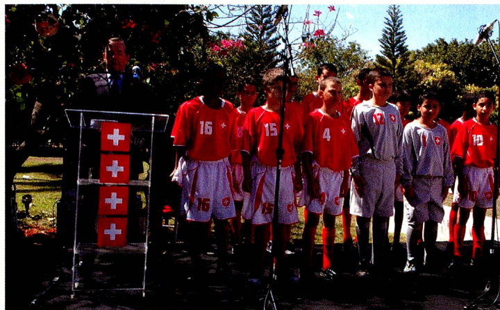
O Embaixador Rudolf Baerfuss e a turma do Centro Educacional de Brazlândia

último em romanche, cantados pela turma do Centro Educacional de Brazlândia, a mesma que defendeu a camisa suíça na Euro Copa Mirim 2008 em junho passado. À noite, a festa para os compatriotas suíços do Distrito Federal e de Goiás seguiu as tradições populares do 1º de agosto: o toque dos sinos seguido da reprodução do discurso do Presidente da Confederação, Pascal Couchepin, a fogueira do 1º de agosto, raclette e salsichão. Tudo regado a muita animação e música ao vivo de alta qualidade.