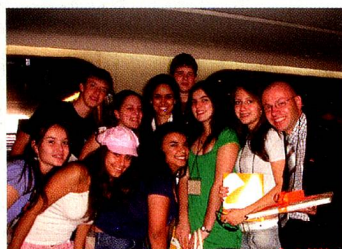
A turma 10a, com a bisneta de Jucelino Kubitschek (no meio).