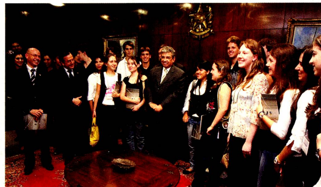
Os estudantes do Colégio Suíço em Curitiba visitam o Congresso Nacional e são cumprimentados pelo Presidente do Senado, Garibaldi Alves

Na embaixada o grupo assistiu a uma apresentação sobre as Relações Internacionais, a Suíça em sua diversidade, a Organização das Nações Unidas e a UNODC (Organização das Nações Unidas Contra Drogas e Crimes), além da apresentação dos diplomatas e o dia a dia em uma embaixada.