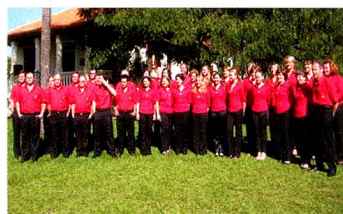
O Jodlerklub Helvetia em frente ao Centro de Memória

Quem quiser conhecer um pouco mais da nossa história pode acessar o site: www.helvetia.org.br e o álbum de fotos do Jodlerklub: http://picasaweb.google.com/jodler.helvetia