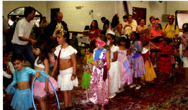
As crianças se divertiram na matiné de carnaval do Clube Helvetia.

As crianças dançaram, fizeram cordão e fila para participar do concurso de fantasias e finalmente todos ganharam em alegria, brincadeiras, criatividade e muita vontade de viver o espírito do carnaval brasileiro regado a marchinhas, confete e serpentina. Foram sereias, fadas, peterpans e super heróis num vôo lindo pela imaginação na magia do Carnaval!