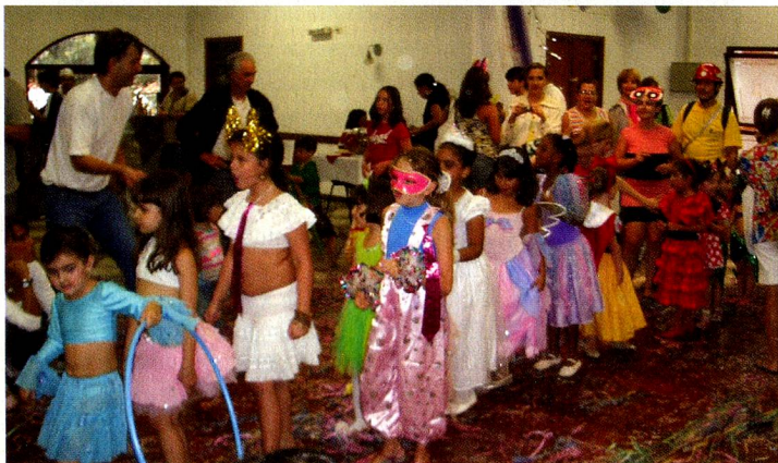
As crianças se divertiram na matiné de carnaval do Clube Helvetia.

As crianças dançaram, fizeram cordão e fila para participar do concurso de fantasias e finalmente todos ganharam em alegria, brincadeiras, criatividade e muita vontade de viver o espírito do carnaval brasileiro regado a marchinhas, confete e serpentina. Foram sereias, fadas, peterpans e super heróis num vôo lindo pela imaginação na magia do Carnaval!