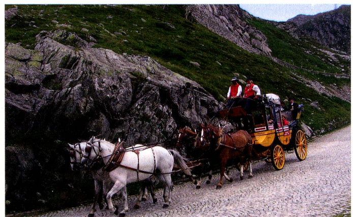
Die Gotthardkutsche in der Tremola