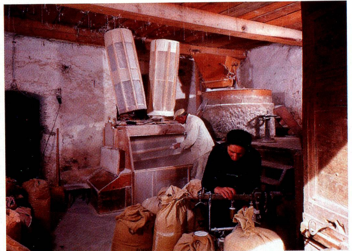
Kornmühle in Poschiavo.