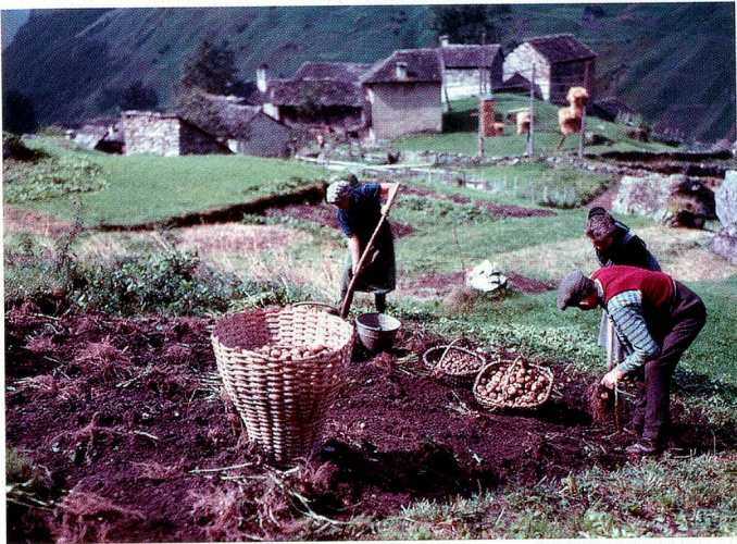
Kartoffellese in Malvaglia.

Bergleben. Peter Ammon (1924) ist einer der ersten Schweizer Fotografen, der bereits in den Fünfzigerjahren grossformatige Farbbilder machte. Als damals 25-Jähriger faszinierte ihn vor allem das Schweizer Bergleben. Die in diesem Buch erstmals publizierten 125 Aufnahmen zeigen ein Stück Schweiz, wie es in dieser Art selten dokumentiert worden ist. Das Buch kostet 78 Franken und ist in allen vier Landessprachen erschienen. www.aura.ch