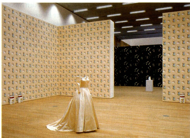
Robert Gober, Untitled, 1989, Installation.