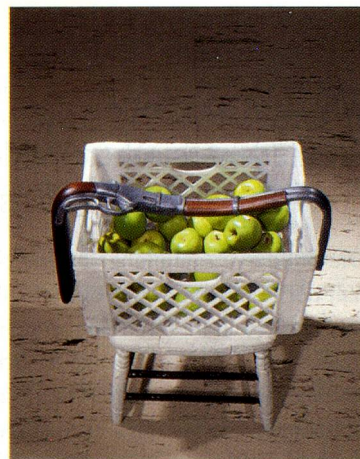
Robert Gober, Melted Rifle, 2006, Gips, Farbe, Kunststoffguss, Bienenwachs, Nussbaumholz, Blei.