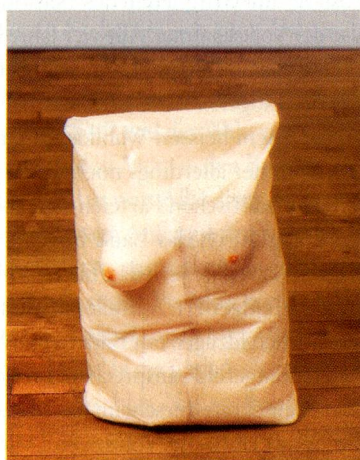
Robert Gober, Untitled, 1991, Holz, Bienenwachs, Leder, Stoff und Menschenhaar.