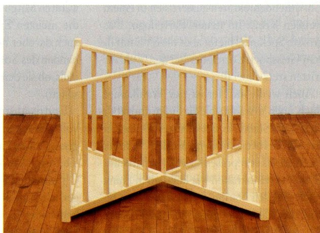
Robert Gober, X Playpen, 1987, Holz und Lackfarbe.