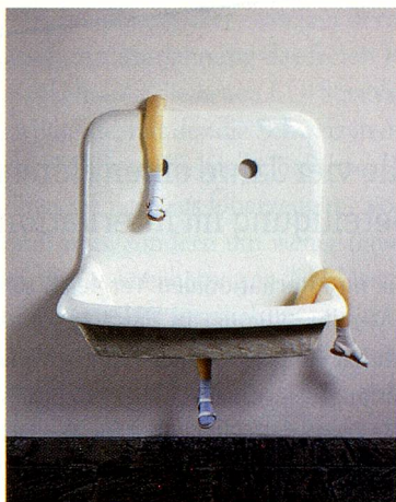
Robert Gober, Untitled, 1999–2000, Gips, Bienenwachs, Menschenhaar, Baumwolle, Leder, Aluminium-Laschen, Lackfarbe.