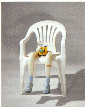
Robert Gober, Untitled, 2005–2006, Steinzeug, Bienenwachs, Baumwolle, Leder, Aluminium-Laschen, Menschenhaar, Bleikristallguss, Aluminiumfolie, Ölack- und Acrylfarbe.

Robert Gober im Schaulager. In den Ausstellungsräumen des Schaulagers in München – vor den Toren Basels – ist bis zum 14. Oktober die bisher umfassendste Werkschau des amerikanischen Künstlers Robert Gober zu sehen. Ausgestellt sind 40 Skulpturen, fünf grossräumige Installationen und mehrere Zeichnungsgruppen, die über die letzten drei Jahrzehnte entstanden sind und eine starke Faszination ausüben. www.schaulager.org