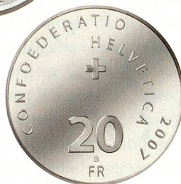
100 Jahre Schweizerische Nationalbank 2007, Silber, Nennwert 20 Franken.