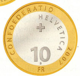
Schweizerischer Nationalpark, Steinbock 2007, Bimetall, Nennwert 10 Franken. www.swissmint.ch

Mit der Schweizerischen Nationalbank (SNB) und dem Schweizerischen Nationalpark (SNP) stehen zwei wichtige Institutionen des Landes im Mittelpunkt der neuen Prägung: Die SNB als Hüterin des Schweizer Frankens, der SNP als geschützter Lebensraum für Flora und Fauna.