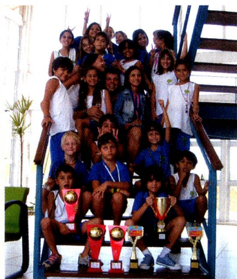
Os atletas do Colégio Marie Jost e seus trofeus

O Colégio Marie Jost se destaca na 13ª Edição dos Jerninhos