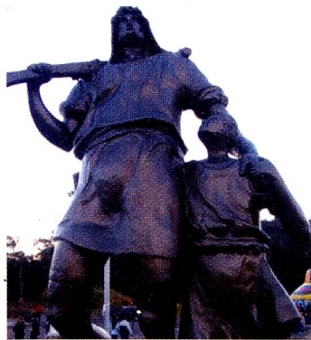
A estátua de Guilherme Tell, medindo quase 4 metros

Já se passaram duas décadas desde a inauguração da Queijaria Escola Suíça, no dia 1º de agosto de 1987, na Estrada Nova Friburgo - Teresópolis, na região serrana do Estado do Rio de Janeiro.