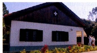
O acolhedor Retiro Suíço

Lembramos que a Associação Suíça de Beneficência Helvetia possui um Retiro Suíço, um lar para idosos, localizado em meio