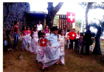
A presença de muitas crianças alegrou a festa.