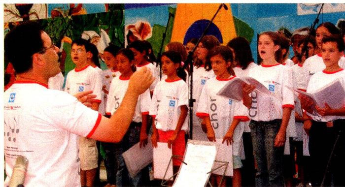
Fez parte da programação, o coral 50 Vozes da Cidadania, formado por alunos do colégio e integrantes do Grupo Escoteiro Guardião das Águas, de Piraquara.

Buscando ilustrar tanto a cultura brasileira quanto a suíça, no interior do ginásio foi instalado um mural temático com 48m² de autoria do artista plástico Jorge Cardozo Pagano, que retrata todos os Estados da Suíça e a interação Brasil-Suíça. O Cantão de Argóvia é um Estado situado ao norte da Suíça e possui uma população de pouco mais de 550 mil habitantes. É rico no cultivo de uva, frutas e cereais. Seu idioma é o alemão e sua capital é Aarau.