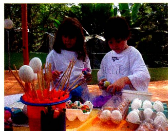
A alegre pintura dos ovos.

Na Páscoa, as crianças da Educação Infantil se envolvem com histórias, músicas e pintura de ovos, entre outras atividades. A pintura dos ovos é uma tradição européia, que é mantida em nossa Escola. As crianças se divertem enfeitando os ovos, resultando no Osterbaum. Claro