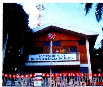
A Casa Suíça da Bahia