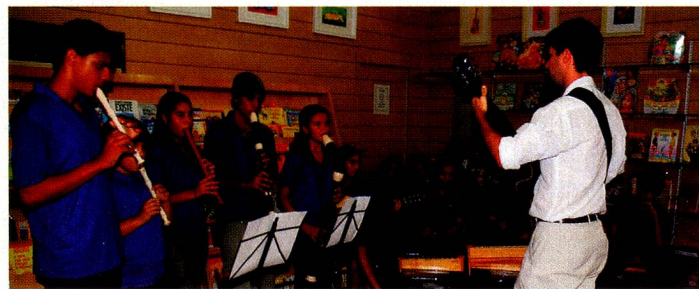
Alunos do Colégio Marie Jost