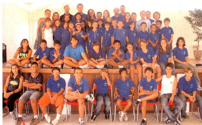
Alunos e professores do Colégio Marie Jost.