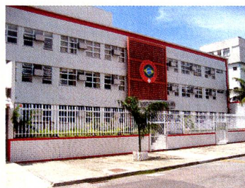
A Escola Suíço-Brasileira na Rua Corrêa de Araújo na Barrinha