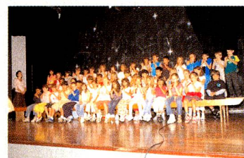
Cerimônia da passagem dos alunos para o 2º ano do Ensino Fundamental

Parabéns aos alunos e professores pelo êxito! A média dos nossos alunos nas provas IB (International Baccalaureate) foi de 30 pontos, mantendo um bom desempenho e abrindo o caminho para os estudos no exterior. Este resultado é uma demonstração de que os alunos da Escola Suíço-Brasileira de São Paulo estão conseguindo atingir os objetivos propostos.