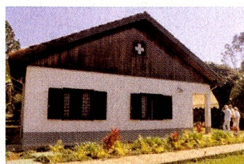
O acolhedor Retiro Suíço

No caso de pacientes em convalescença, o Retiro também é disponível para estadia temporária. Há vagas disponíveis e se desejar maiores informações, visite no site www.beneficiencia-suica.com.br ou entre em contato pelo telefone: 11 / 5071-2910.