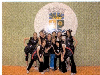
A Equipe campeã de voleibol feminino

No mês de outubro, o Colégio Suíço participou dos "JIEP'S 2006", com várias equipes e modalidades. Estes jogos são classificatórios para os JOGOS COLEGAIS DO PARANÁ - JOCOP'S 2007. O campeão de cada modalidade está classificado e representará o Município de Pinhais.