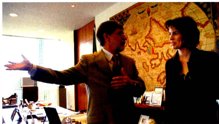
Os ministros Celso Amorim (Relações Exteriores) e Doris Leuthard, na entrevista coletiva para a imprensa em Brasília

Na Bahia, a ministra esteve em Feira de Santana, onde participou, juntamente com o presidente da República, Luiz Inácio Lula da Silva, o governador Jaques Wagner, e a direção da Nestlé, da inauguração de uma nova fábrica da empresa. Em conversa com a imprensa local, Doris Leuthard lembrou que os investimentos (estoque) suíços no Brasil superam a cifra de US$ 5 bilhões, sendo que a metade desse total foi investida nos últimos dois anos. Além disso, as empresas suíças empregam cerca de 91 mil pessoas.