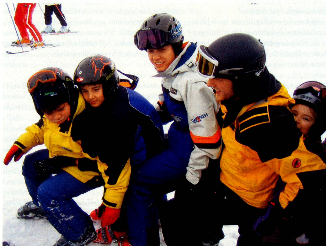
Winterlager der SJS im Februar 2006.

www.aso.ch (Rubrik Jugend / Ferienkolonien für 8 bis 14-Jährige / Winterlager)