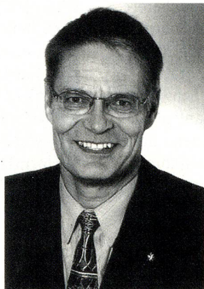
Generalkonsul Hans Dürig

Eine ideale Plattform für solche Treffen die Schweizer Clubs