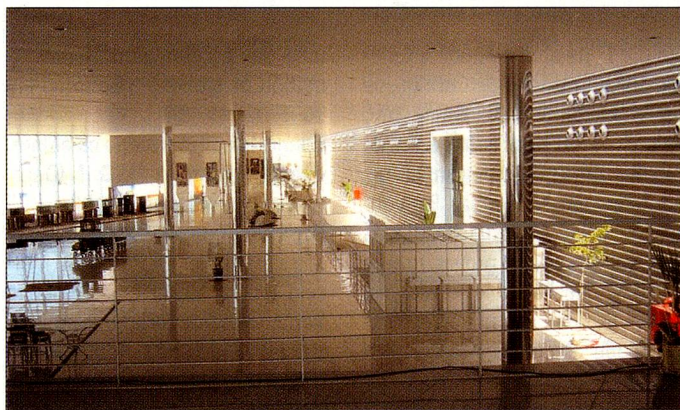
Os eventos do BID em Belo Horizonte aconteceram no belo complexo arquitetônico EXPOMINAS

O mês de abril deixou Belo Horizonte no foco das atenções, por ser a sede de vários eventos do BID (Banco Interamericano de Desenvolvimento), que reuniram representantes dos 47 países associados, incluindo a Suíça. Os eventos foram realizados na EXPOMINAS, que possui um complexo arquitetônico extraordinário.