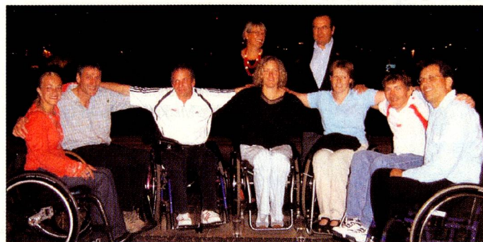
O Embaixador da Suíça no Brasil, Sr. Rudolf Baerfuss e Sra. Beatrice, junto às equipes masculina e feminina que disputaram o Campeonato Mundial de Tênis em Cadeira de Rodas.

O tour terminou no fim da tarde, à beira do Lago Paranoá, quando os convidados puderam apreciar o pôr-do-sol e tomar um chopinho gelado. Além do passeio, a Embaixada também ofereceu aos jogadores um coquetel, no dia 4 de maio. O evento também homenageou as equipes da Áustria.