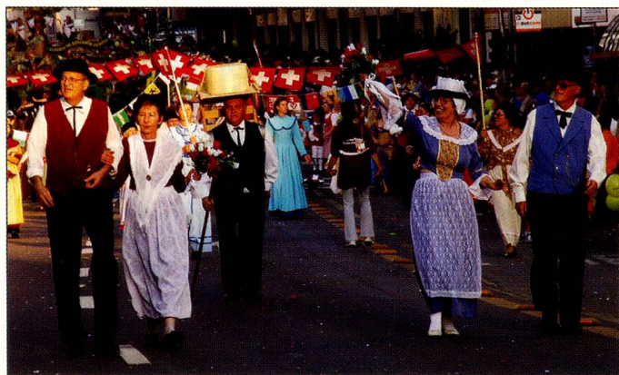
O grupo suíço que participou do primeiro desfile do Corso Alegórico da Festa da Uva 2006

Após a abertura oficial nos pavilhões, houve o desfile na rua principal da cidade, onde um grupo Suíço participou neste dia e em mais seis outros dias.