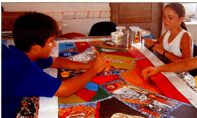
Os princípios pedagógicos do Colégio Marie Jost são baseados em moldes suíços