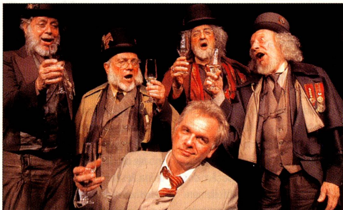
O elenco na ótima montagem de "A Pane" no Rio de Janeiro.

representam um tribunal e o hóspede é réu submetido a um julgamento de faz-de-conta. Nesta obra datada de 1956, adaptada pelo advogado criminalista brasileiro Nilo Batista, Dürrenmatt concebe uma bela e devastadora história, estimulante à reflexão e ao debate sobre a crise de valores do homem contemporâneo. Em cartaz até 14 de maio, vale a pena assistir a este espetáculo inédito no Brasil.