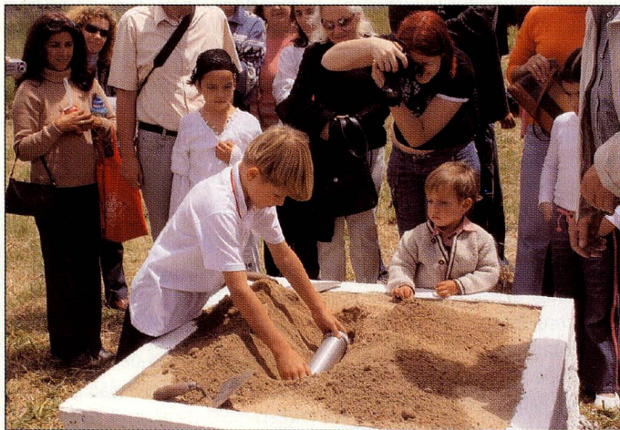
A pedra fundamental do ginásio.

construção está previsto para o começo de 2006. Durante as comemorações para o Dia Nacional da Suíça em agosto, o Colégio Suíço-Brasileiro de Curitiba, junto com representantes da Suíça, pais, alunos, professores e funcionários celebrarão a inauguração do Ginásio com uma grande festa.