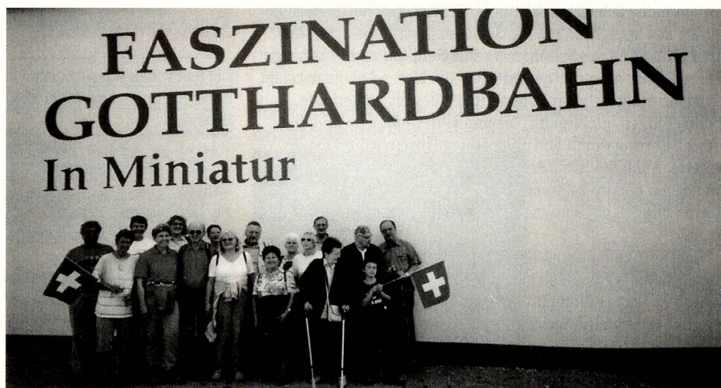
Dass der Gotthard (auch) in Rothenburg liegt, wissen die Mitglieder des Schweizer Vereins Nürnberg.