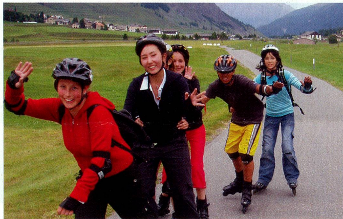
Inlineskaten in und um La Punt im Engadin.

Einige treue Kunden treffen sich seit Jahren in diesem Lager. Neueinsteiger sind herzlich willkommen. Eine Woche mit viel Schneesport in allen Variationen und Kontakten zu Auslandschweizern aus aller Welt.