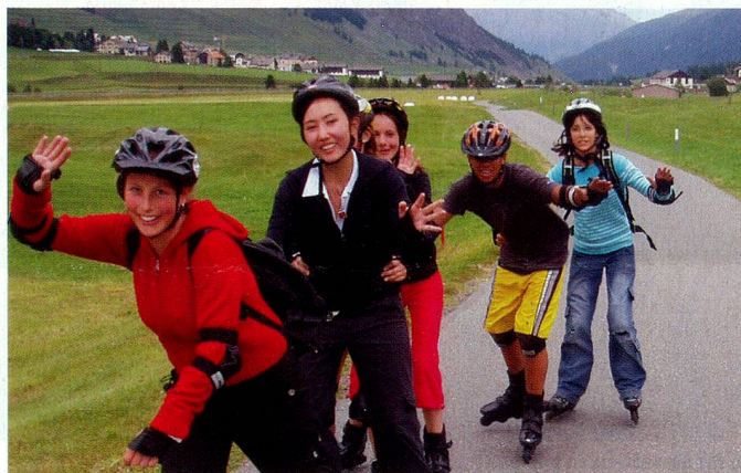
Inlineskaten in und um La Punt im Engadin.

Einige treue Kunden treffen sich seit Jahren in diesem Lager. Neueinsteiger sind herzlich willkommen. Eine Woche mit viel Schneesport in allen Variationen und Kontakten zu Auslandschweizern aus aller Welt.