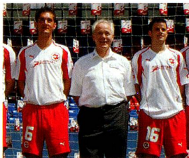
Köbi Kuhn, Nationaltrainer