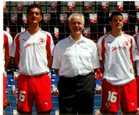
Köbi Kuhn, Nationaltrainer

Auf Grund der grossen Zahl von Zuschriften, welche die Neugestaltung zum Thema haben, finden Sie in dieser Nummer eine zusätzliche Seite mit Leserbriefen. HEINZ ECKERT