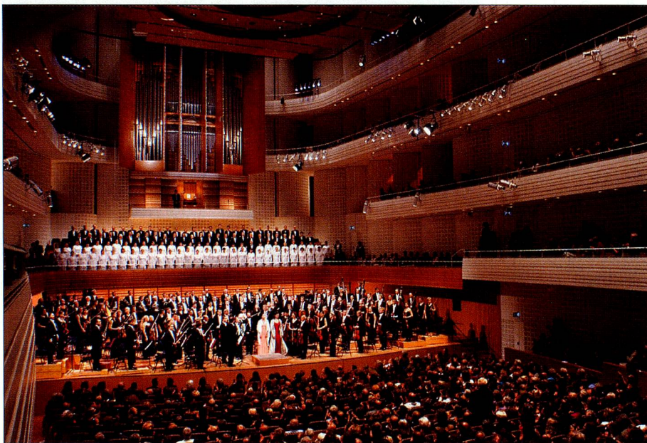
Perle im Festivalsommer: Sinfoniekonzert in Luzerns «Salle blanche».

In der Ostschweiz liegt dem Openairfestival von St. Gallen ebenfalls die Idee campierender Festivalbesucher zu Grunde. Auf einer weitläufigen Waldlichtung reiht sich dort Zelt an Zelt. Für die rund 72 000 Zuschauer hält die 29. Auflage das gewohnt starke Angebot bereit, darunter als Exklusivität für die Schweiz der Auftritt von R.E.M., einem der populärsten Rockensembles der Welt. Neu im Festivalkalender 2005 figuriert das attraktive Greenfield Festival, das in Interlaken stattfindet und eine Mischung aus New und Alternative Rock bietet. Und schliesslich lädt das in seiner Art einmalige Rock Oz'Arènes die Musikfans seit 1992 an den ältesten Schauplatz der Schweiz ein – in das Amphitheater der berühmten römischen Ruinen von Avenches.