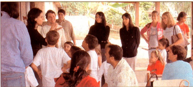
ESB - Santa Teresa

Esses trabalhos foram executados com muito empenho e carinho onde eles utilizaram toda a criatividade na sua confecção.