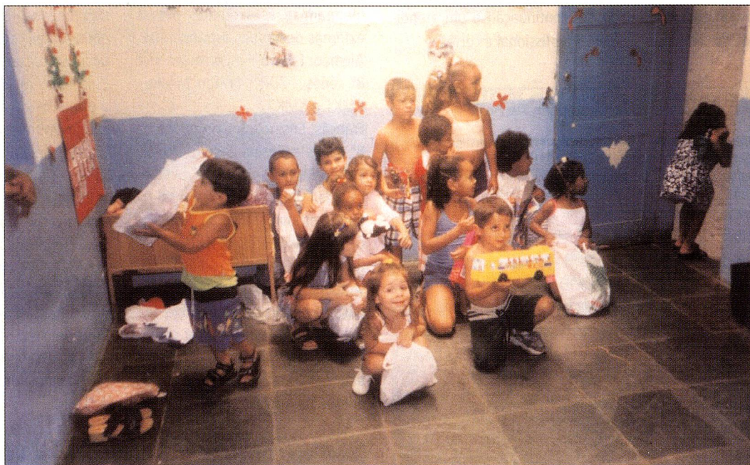
Sala de Aula na Comunidade Jardim Serrano em Teresópolis.

A Vivamos Melhor é uma Organização sem fins lucrativos, apoiada pela "Stiftung Vivamos Mejor", uma Organização Internacional situada na cidade de Berna, na Suíça, que fornece ajuda ao autodesenvolvimento da comunidade, coordenando e co-financiando atualmente cerca de 20 projetos sociais na América Latina (Brasil, Colômbia, Costa Rica, Equador, Guatemala, Nicarágua e Venezuela). No Brasil, Vivamos Melhor já