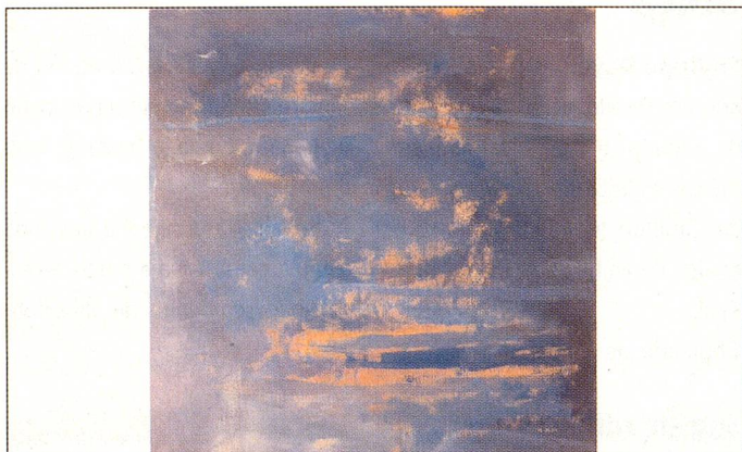
"Um dia de verão no inverno", tela de Urs Kamm exposta no Rio.

No próximo mês de maio de 2005 o Centro Cultural Suassuna oferece seus espaços ao artista plástico suíço Urs Kamm para expor as suas mais recentes telas.