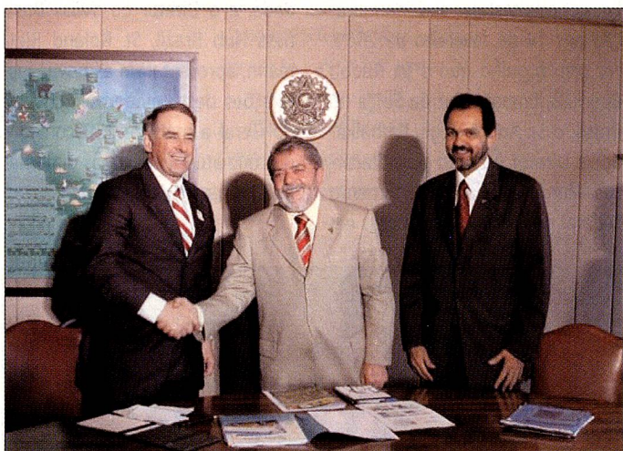
Adolf Ogi com o Presidente Lula e o Ministro Agnelo Queiroz.