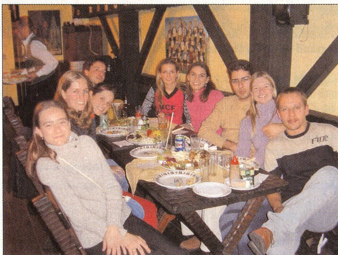
Ex-Alunos do Colégio Suíço-Brasileiro de Curitiba