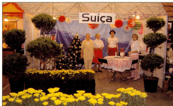
O stand da Suíça foi muito visitado e elogiado

francesa, italiana, espanhola, holandesa, japonesa, austríaca, alemã, africana, açoriana, tcheca, etc.