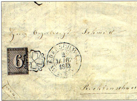
Schweizer Premiere: Der erste bekannte Brief der Schweiz, der mit einer Briefmarke frankiert ist, datiert vom 2. April 1843.