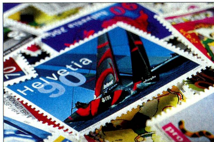
Weltberühmt: Auf die Sondermarke «Alinghi, Switzerland» setzte ein wahrer Run ein. Schon kurz nach dem Ausgabebetag waren die Kleinbogen ausverkauft.