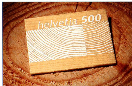
Aus Holz: Bei der Entwicklung und Gestaltung stand der nachhaltige, vielseitig verwendbare Rohstoff im Vordergrund. Damit wird nicht nur die Einzigartigkeit dieser Marke, sondern auch der Pioniergeist der Post spürbar.