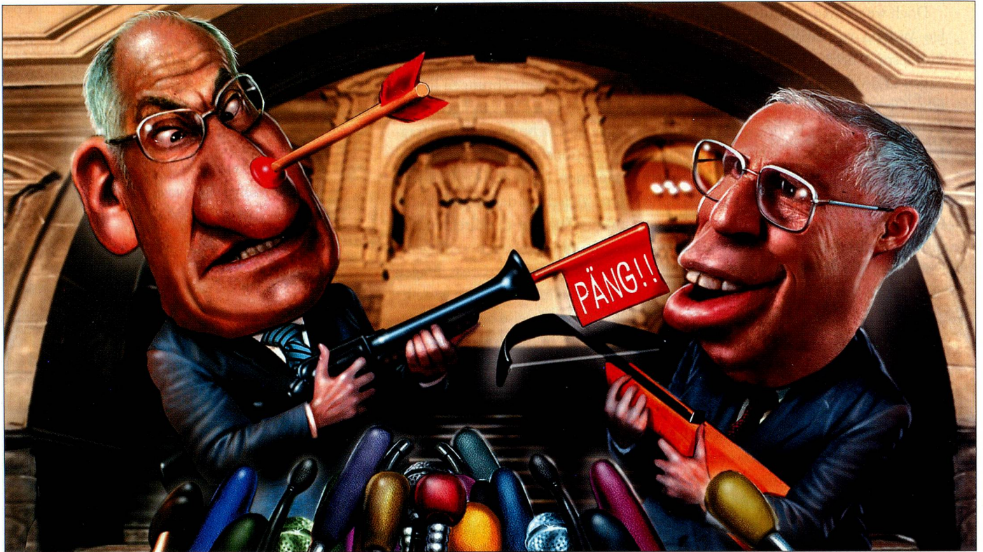
Illustration: Igor Kravarik.

Die Schweiz ist stolz auf ihre direkte Demokratie. Dennoch wird über die Rolle des Volkes und die «Reformunfähigkeit» in der demokratischen und föderativen Eidgenossenschaft heftig gestritten.