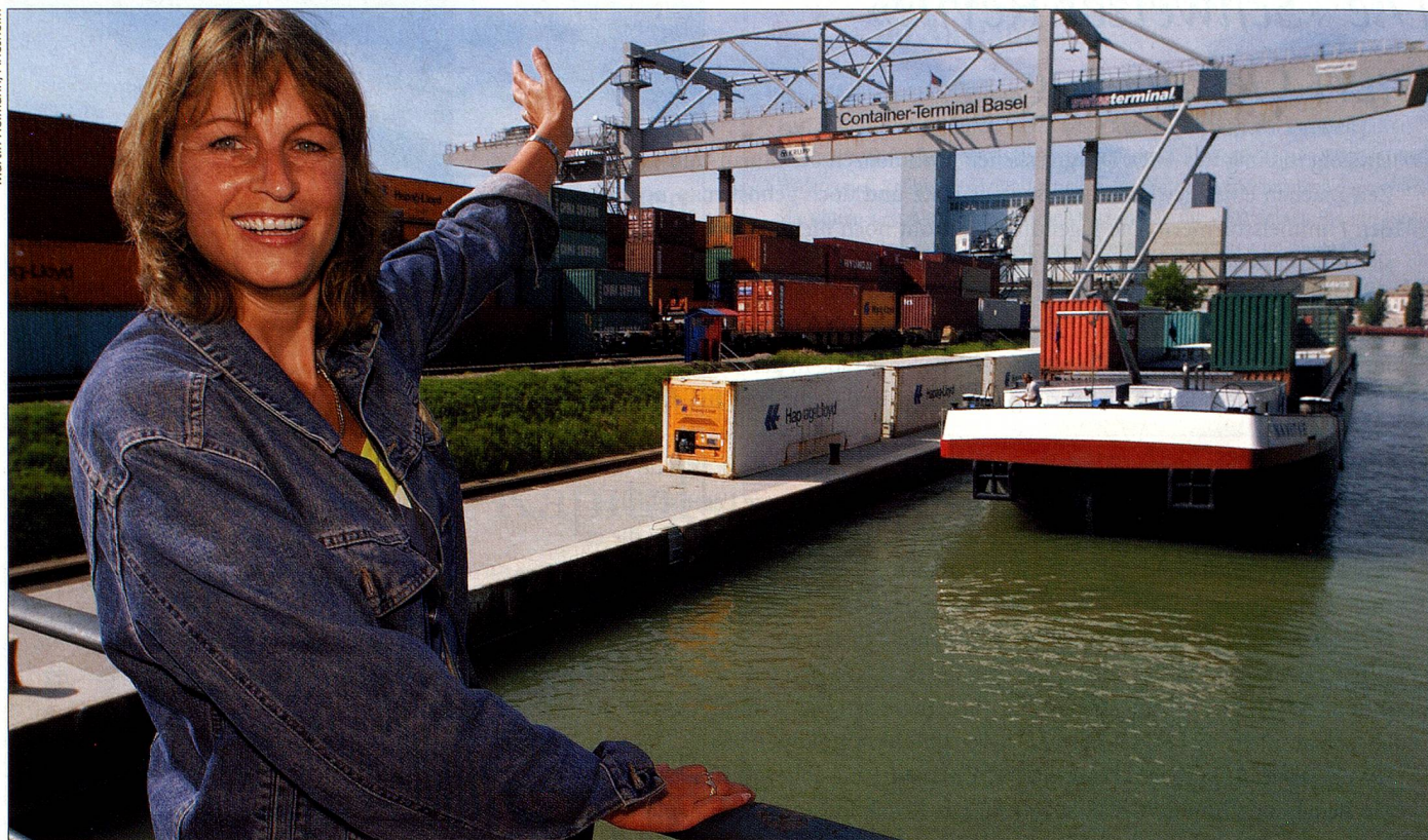
Die Würfel sind gefallen, der Hausrat verlässt den Rheinhafen.