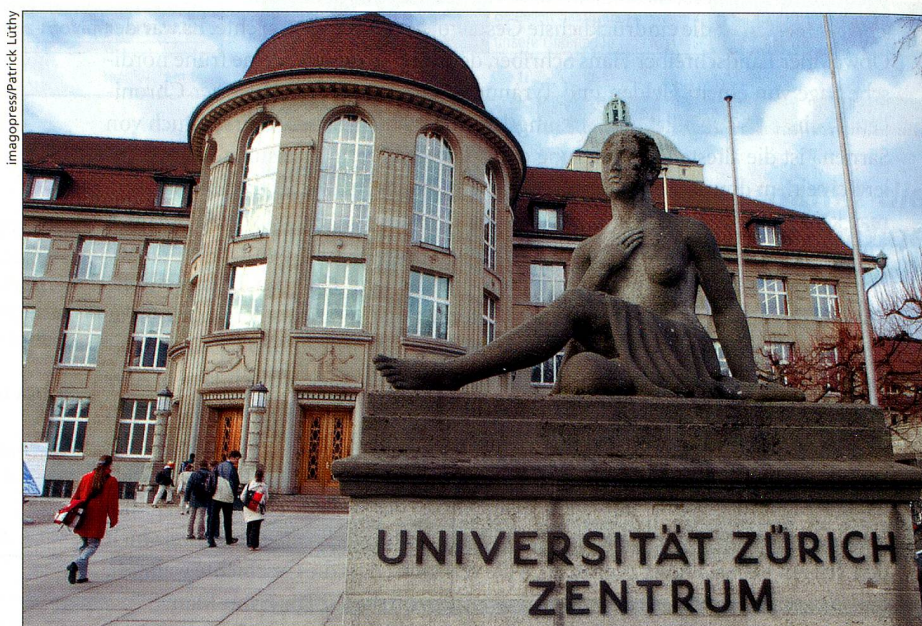
Schweizer Hochschulen wollen der Mobilität gerecht werden.

DIE HOCHSCHULBILDUNG sei ein vorrangiges Anliegen des Bundesrates, erklärte im Dezember Pascal Couchepin, oberster Bildungspolitiker unseres Landes. Das zeigt sich schon bei dem gewaltigen Prozess, den die Bildungsminister von 29 europäischen Staaten 1999 in Bologna in Gang gebracht haben. Für die Schweiz hat Charles Kleiber, Staatssekretär für Wissenschaft und Forschung, den Text paraphrasiert. Die «Bologna-Deklaration» – so genannt nach dem symbolträchtigen Ort ihrer Unterzeichnung, der ältesten Universität Europas – schafft ein System leicht verständlicher und vergleichbarer Abschlüsse, einen «europäischen Hochschulraum», in dem sich Studenten und Dozenten frei bewegen sollen. Ziel ist die Beschäftigungsförderung. Zu Gunsten der weltweiten Wettbewerbsfähigkeit der europäischen Hochschullandschaft werden