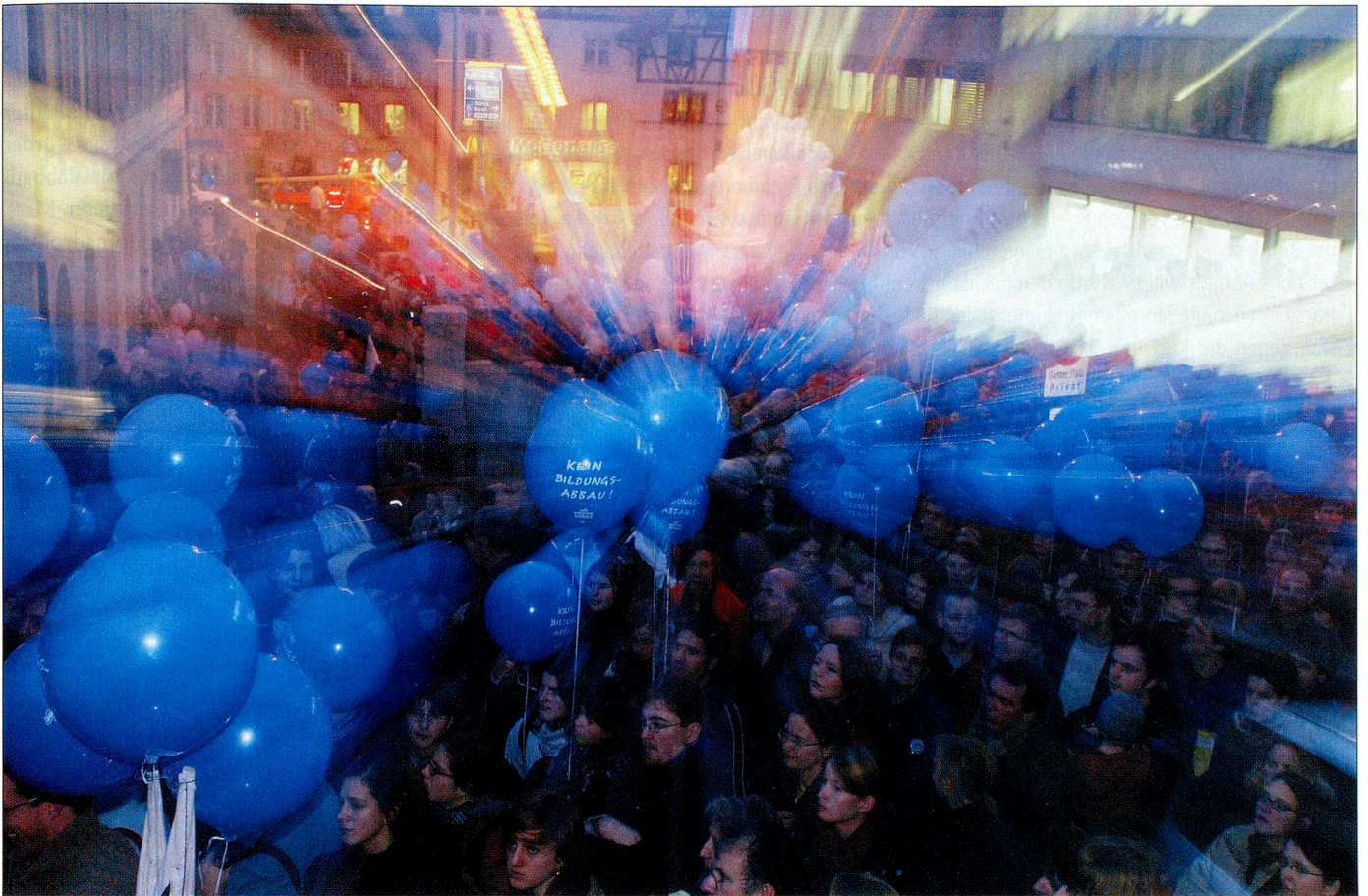
Widerstand gegen das Entlastungsprogramm leistete das rot-grüne Lager. Im Bild eine Kundgebung in Aarau gegen Sparpläne.