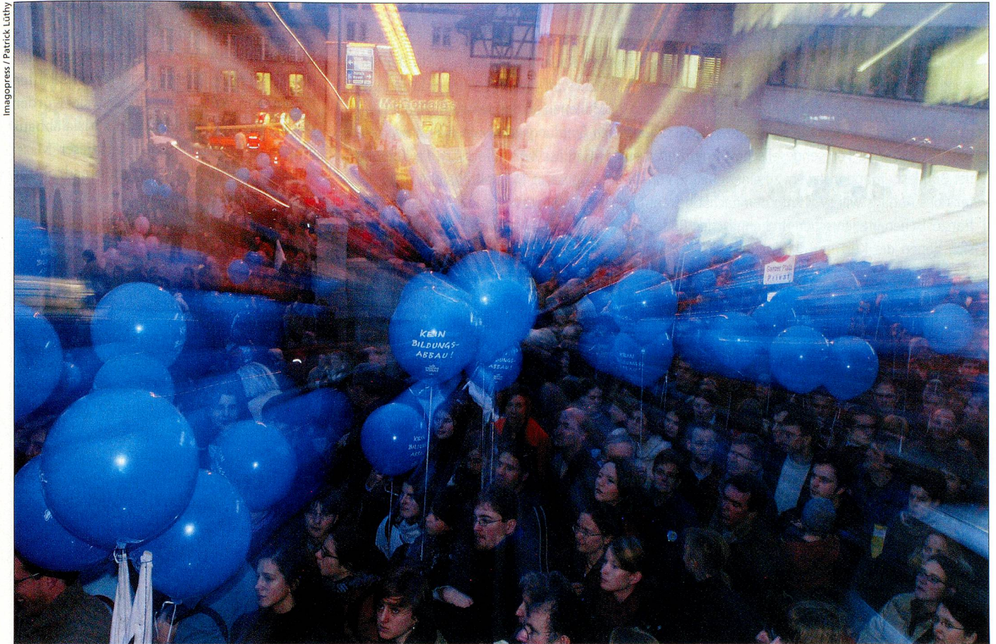
Widerstand gegen das Entlastungsprogramm leistete das rot-grüne Lager. Im Bild eine Kundgebung in Aarau gegen Sparpläne.