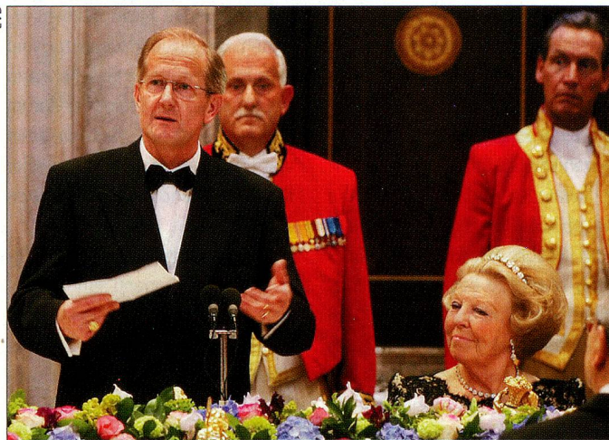
Bundespräsident Deiss unterstreicht gegenüber Königin Beatrix die guten Beziehungen der Schweiz zu den Niederlanden.

Inzwischen war der Bundespräsident und seine Frau in den königlichen Palast am Dam zurückgekehrt. Auf Einladung von Königin Beatrix fand hier das offizielle Staatsbankett statt. Nebst der Gastgeberin Königin Beatrix und