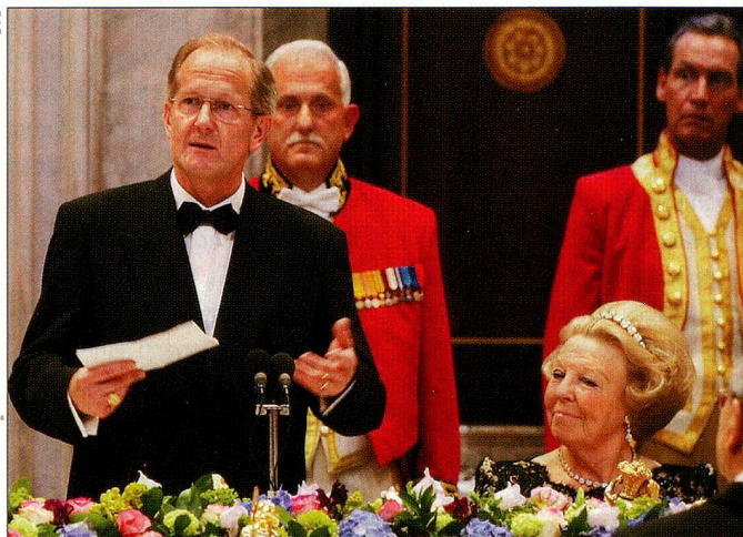
Bundespräsident Deiss unterstreicht gegenüber Königin Beatrix die guten Beziehungen der Schweiz zu den Niederlanden.

Inzwischen war der Bundespräsident und seine Frau in den königlichen Palast am Dam zurückgekehrt. Auf Einladung von Königin Beatrix fand hier das offizielle Staatsbankett statt. Nebst der Gastgeberin Königin Beatrix und